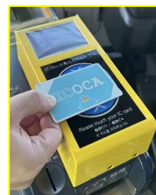
降車時 （黄色リーダー）