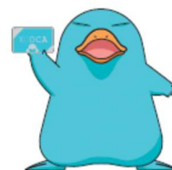
ICOCAマスコット キャラクター 「カモノハシのイコちゃん」